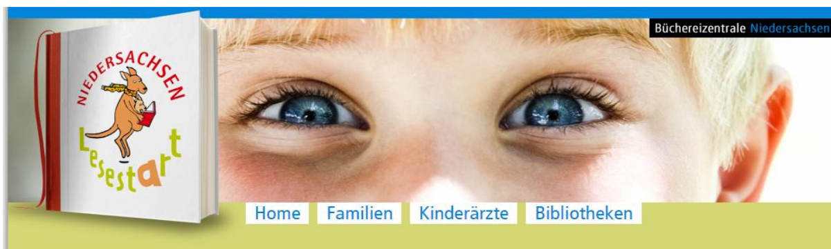
Abb. 4: Screenshot (Ausschnitt) des Web-Auftrittes zu Lesestart Niedersachsen (Abruf am 04.01.2019)

Mit Projektbeginn wurde eine Projekt-Homepage entwickelt, die sich an die drei Hauptgruppen des Projektes wendet: Bibliotheken, Kinderärzte und Familien. Die zahlreichen Informationen über frühkindliche Sprachförderung, die Rolle des Vorlesens und zentrale Projektinformationen sind dort in ihren Kernaussagen auch in Russisch und Türkisch wiedergegeben. Weiterhin sind die teilnehmenden Bibliotheken und Kooperationspartner sowie Pressematerialien auf der Website zu finden. Für die Bibliotheken sind Handreichungen, unterstützende Angebote und Materialien bereitgestellt. Auf der Homepage der Büchereizentrale ist ebenfalls ein spezieller Bereich zu Lesestart Niedersachsen eingerichtet worden.