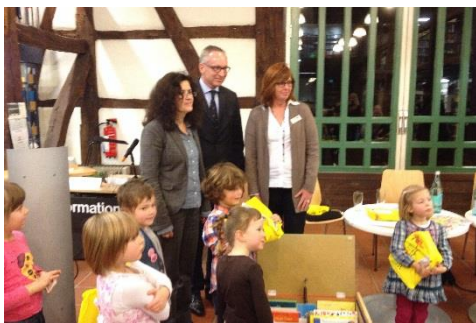
Abb. 1: Eröffnung der Phase II der Bundeskampagne

Lesestart Niedersachsen hat das zentrale Ziel einer breitenwirksamen und kontinuierlichen Sprach- und Leseförderung für Kleinkinder. Die Beschäftigung mit Sprache, Literatur und Büchern wird möglichst frühzeitig im Alltag der Kinder und Lesen als fester Bestandteil in den Familien verankert. Die an Lesestart Niedersachsen teilnehmenden Öffentlichen Bibliotheken werden zu einer dauerhaften Anlaufstelle für junge Familien in ihrer Gemeinde oder Stadt und etablieren sich - mittels projektbegleitender Veranstaltungen und Maßnahmen - als wesentlicher Partner der Lese- und Sprachförderung. Ein immer wichtiger werdender zusätzlicher Schwerpunkt von Lesestart Niedersachsen liegt in der Förderung von Familien, in denen das Vorlesen und die gemeinsame Beschäftigung mit Büchern, Sprache und Texten nicht zur Tradition gehören.