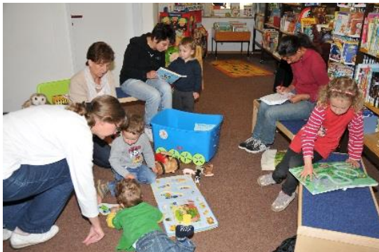
Abb. 3: Bücherei Steinkirchen-Grünendeich