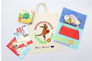
Abb. 2: Lesestart Niedersachsen-Set; Foto: Büchereizentrale Niedersachsen

Somit wurden im 8. Projektjahr ca. 42 % der Einjährigen in Niedersachsen mit Lesestart-Sets versorgt. Der Wert liegt etwas unter dem Versorgungsgrad des Vorjahres, da die Anzahl der Geburten in Niedersachsen 2016 im Vergleich zum Vorjahr um ca. 12 % gestiegen ist auf 75.215 3 .