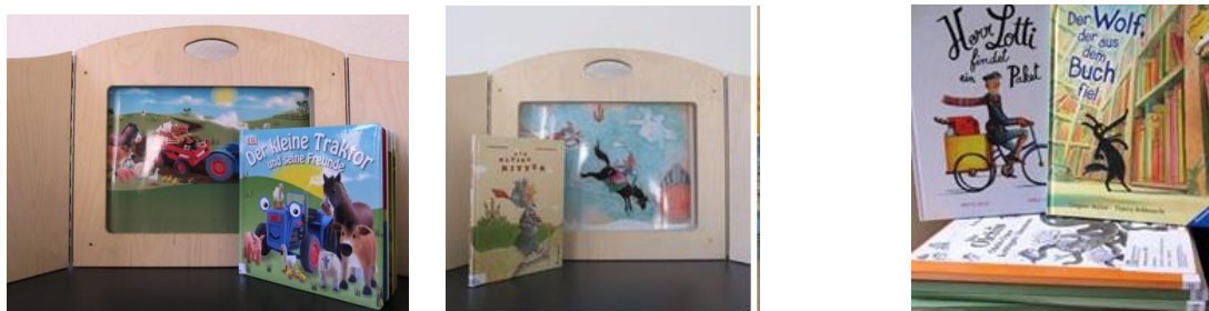
Abb. 6: Beispiele für Kamishibai und Bilderbuchkino; Fotos: Büchereizentrale Niedersachsen

Insgesamt wurden die Bildkarten-Sets über 570 x entliehen und in den Bibliotheken eingesetzt.